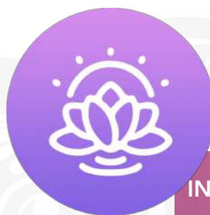
INTERVENANT.E DU CENTRE AYURVEDA MASSAGE

Nos Formateurs & Intervenants ont été choisis de par leur sérieux, leur investissement dans la discipline de l'Ayurveda, du Yoga et de l'énergétique, tous sont diplômés & expérimentés.